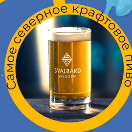
Самое северное крафтовое пиво