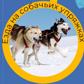
Езда на собачьих упряжках