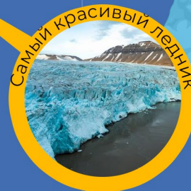
Самый красивый ледник