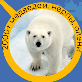
2000+ медведей, нерпы, олени