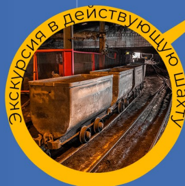
Экскурсия в действующую шахту