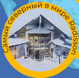
Самый северный в мире Radisson